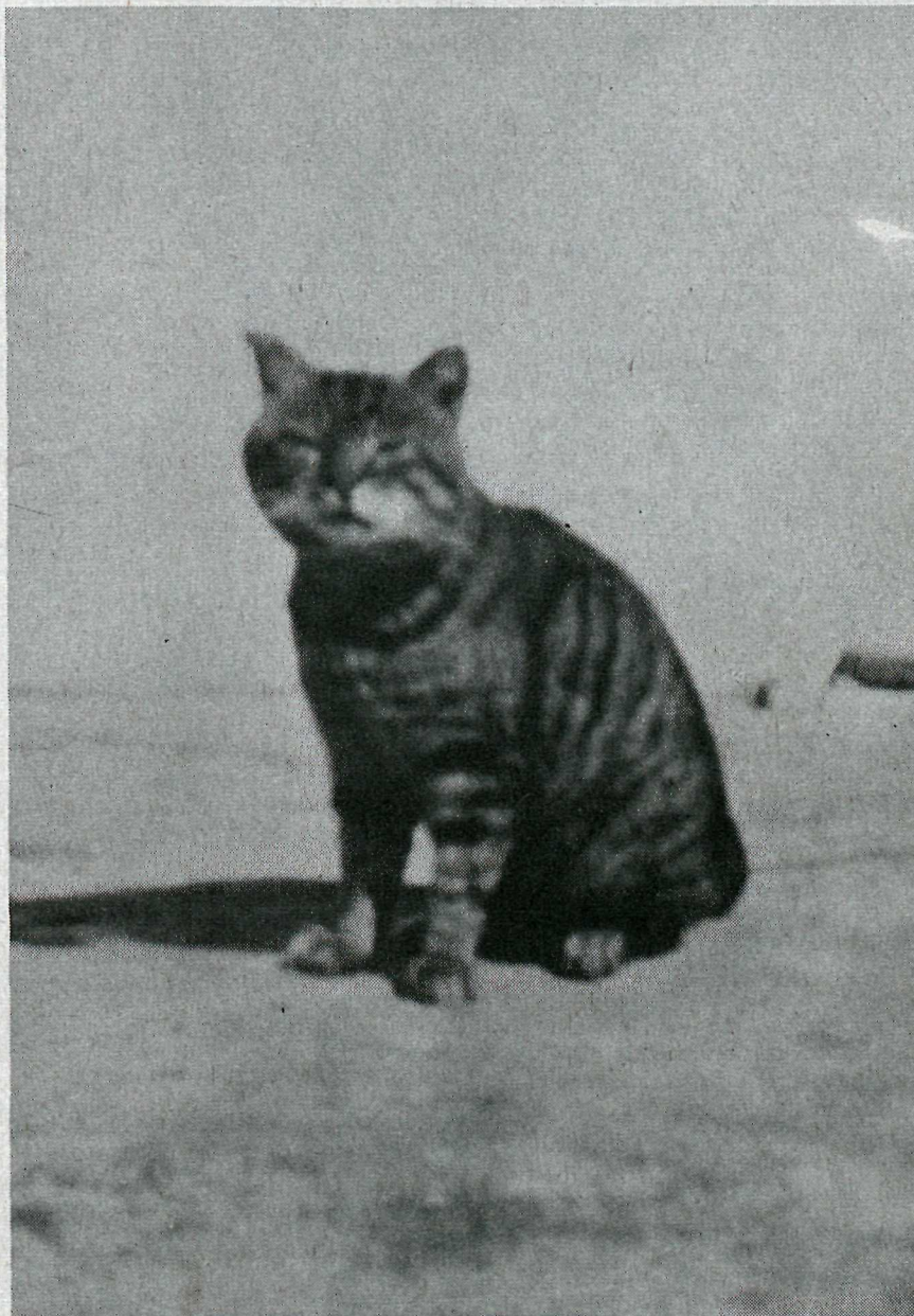
Brandur Brandsson var stór og stæðilegur köttur.

Hversdagslega var Brandur heitinn hægur og hibýlaprúður, beit menn