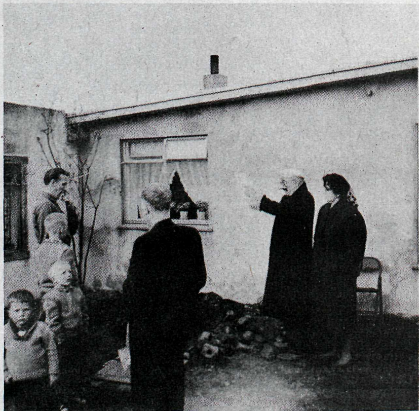
Jarðarförin var býsna fjölmenn og fór virðulega fram.

Eins og áður segir, var Brandur mikill vexti og vörpulegur, belgurinn gljáandi og yfirbragðið tigulegt. Augun voru gul og lýstu gáfum og miklum þokka. Drengur var hann góður, ef valdir vinir átta í hlut, en