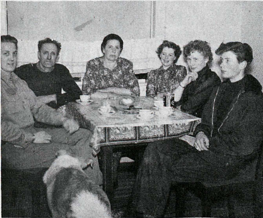
Ög erfisdrykkjan var einnig með fullum sóma, en þó með hófi. Ekkert vín um hönd haft, enda var Brandur bindindisköttur.

öðrum grimmur og tortrygginn. Við fráfall hans er mikill harmur kveðinn að öllum læðum í nágrenninu, og hafa þær eigi treyst sér til þess að fylgja honum til hinztu hvílu.