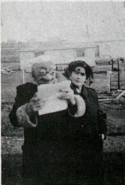
Hljóleg heimiliskveðja var flutt yfir kistu Brands, og talaði þar fjárhaldsmaður Brands og ráðgjafi.

Vottum við þessum læðum dýpstu samúð, sem og fósturu hans, er þykir sjónarsviptir orðið hafa við fráfall þessa mikilsvirta heimilissvinar, og